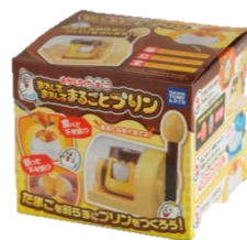
パッケージイメージ