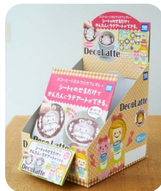
インナーパッケージイメージ