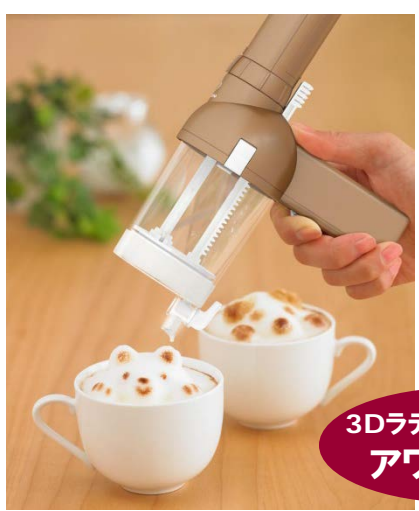
3Dラテアートメーカー アワタチーノ