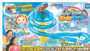
■パッケージイメージ