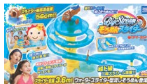
■パッケージイメージ