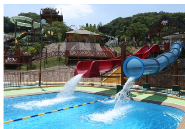
■東京サマーランドのウォータースライダー

ウォータースライダーで人が流れる場所を本商品では5つの「水路」で再現しています。「水路」自体に僅かな高低差をつけたり、くねらせることでウォータースライダーを再現すると同時に、これにより流れるそうめんに動きが出てより流しそうめんを楽しめるようになっています。また、3段目の「曲線水路」にはウォータースライダーにも設置されている「飛び出し防止ガード」を再現したり、「水路」に節を入れるなど細かい部分まで本物に近づけました。