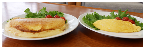
本商品で 作ったオムレツ

同じ卵を使って作ったオムレツを並べて比べてみると、本商品で作ったオムレツは通常のオムレツの約2.5倍で、ボリュームの差は歴然です。卵を混ぜて一般的な手順でフライパンに入れて焼きあげるという工程は全く同じなのに、『ふわしゅわびっくり！レッツ！オムレツ』を使って生地を作るだけで、ふわふわ感が格段にパワーアップします。