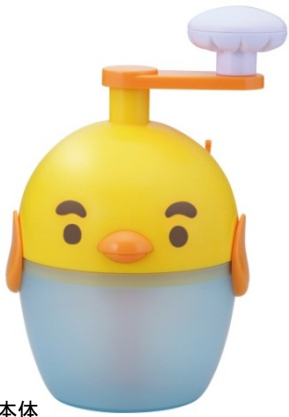
本体 (名前:ガブリエル)

『ふわしゅわ びっくり！レッツ！オムレツ』は、一般に家で作るオムレツとはまったく食感が異なる“ふわふわでシュワシュワ”なオムレツを作ることができる商品です。 約3分間本体のハンドルを回すだけで、一瞬パンケーキと見間違ふほどのボリューム感をもった生地が出来上がり、焼き上がったオムレツを食べると、口の中に入った瞬間にシュワっと溶けてしまう夢のような食感を体験することができます。 手軽に手に入る卵で比較的簡単に作ることができ、子どもが初めて挑戦する料理にもぴったりのオムレツ。 まさに料理の入門編的オムレツが、この『ふわしゅわ びっくり！レッツ！オムレツ』でさらに劇的変身を遂げました。