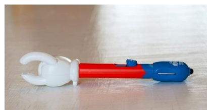
3)指先机上非接触機構

スマートフォンやタブレットを見ながら、読書やゲームをしながら…、生活の様々なシーンで手の汚れを気にせず気軽にポテトチップスが食べられる新デバイス。『スマートポテトチップス』が、現代人のモバイルライフをスマートにサポートします。