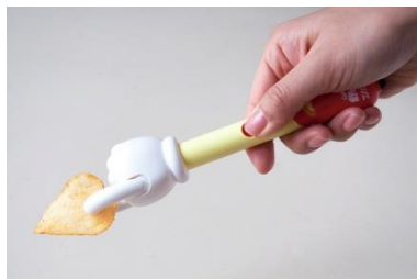
1)対象物破損防止クラッチ機構

本体の指先が机や床などに直接付かないように、手首にあたる部分にスタンドが設けられています。これにより衛生的に使用することができます。