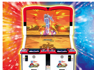
隣接の画面がつながった大迫力のタグプレイ (※画像はイメージになります。)

※「累計プレイ回数」は、コインが筐体に投入された回数を1プレイとして換算しています。