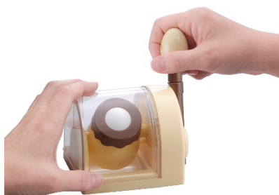
カラメルソースでまるごとプリン

“おうち時間”においしい驚きをお届けする『たまごまるごとプリン』にご注目ください。