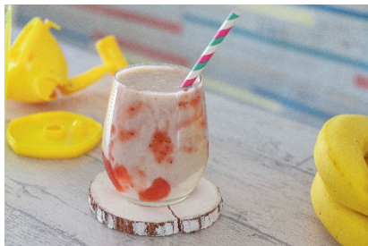
バナナ+いちごのデザートジュース