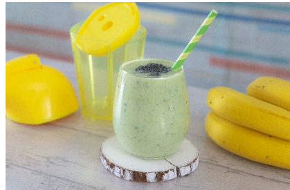
アボカド+黒ごまのヘルシーモーニングジュース