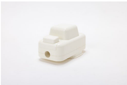
ぬいぐるみ内で最適なボリュームになるよう音量を調整したサウンドユニット