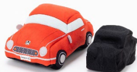
サウンドユニットは布製のカバー付き ※カバーは取り外しできません

外出する機会が増えてきた今、持ち運べるサイズで赤ちゃんと一緒におでかけすることができ、ぐずり泣きしている赤ちゃんに胎内音に近いエンジン音を聞いてもらうことで、安心と笑顔を引き出すお手伝いをします。