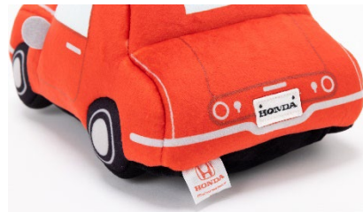
Hondaのオフィシャルライセンス商品であることを示すタグが付いています

「赤ちゃんにもっと、安心を。家族にもっと、移動する喜びを。」というHondaの想いが、玩具の持つ“やさしさ”とモノづくりの工夫で形になりました。Hondaとタカラトミーアーツ、両社の夢が詰まったぬいぐるみ、それが『赤ちゃんスマイル Honda SOUND SITTER』です。