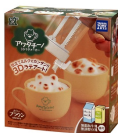
パッケージイメージ