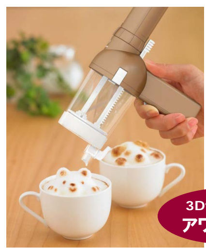
3Dラテメーカー アワタチーノ