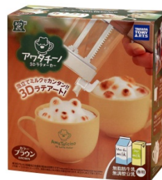
パッケージイメージ