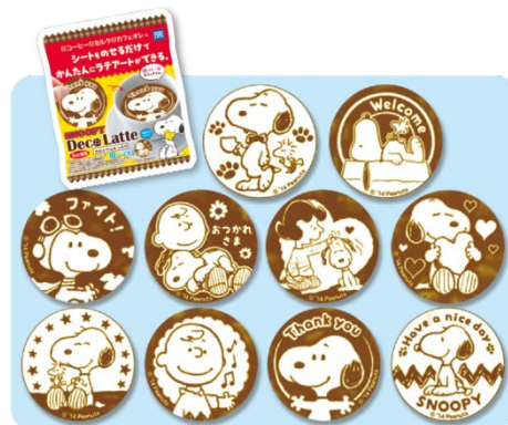
■デコラッテ スヌーピー © 2014 Peanuts Worldwide LLC www.SNOOPY.co.jp