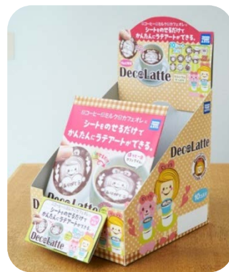
インナーパッケージイメージ